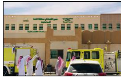
صورة رقم (1) فرضية إخلاء كلية العلوم والدراسات الإنسانية بالغاظ - طالبات.