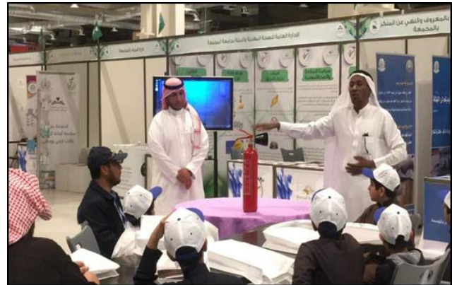
صورة رقم (9) تدريب طلاب على استخدام وسائل السلامة.