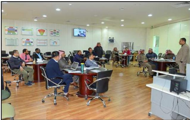
صورة رقم (8) تدريب أعضاء هيئة التدريس على برنامج نظام السلامة والصحة المهنية (OHSAS18001).