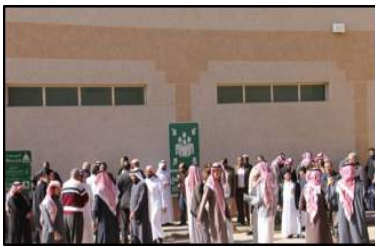
صورة رقم (2) فرضية إخلاء كلية العلوم والدراسات الإنسانية بحوطة سدير - طلاب.