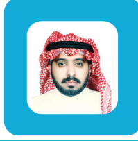
أ. خالد بن عبدالعزيز الناصر